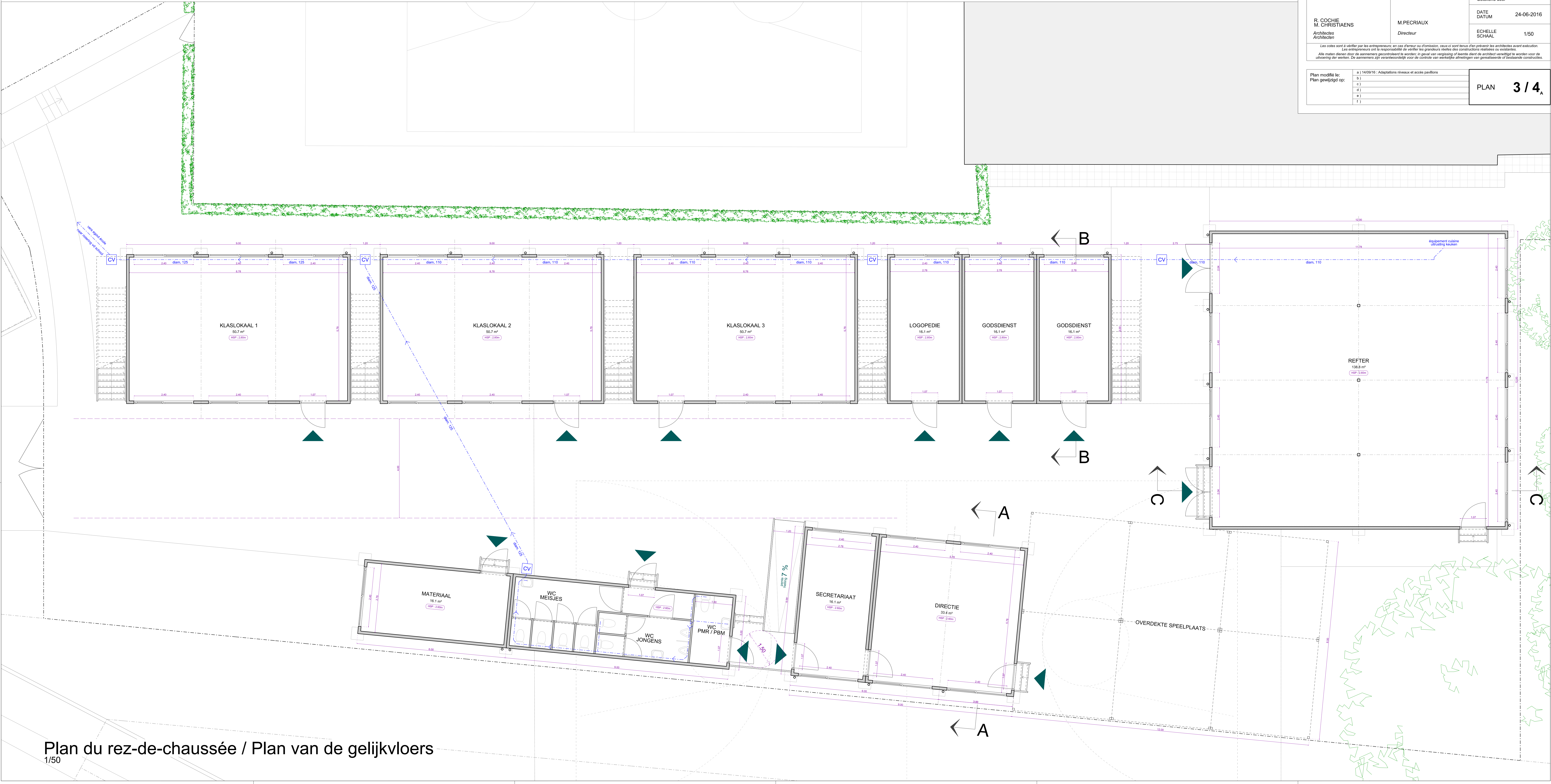
Plan du rez-de-chaussée / Plan van de gelijkvloers