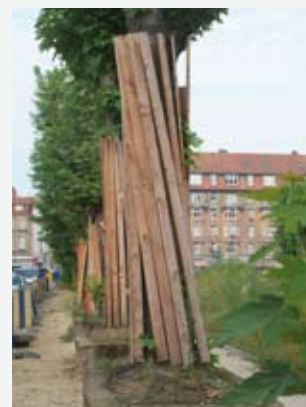
Exemple de protection des arbres.

3° le dégagement de poussières provoqué par le chantier est réduit à son minimum notamment par le recours à des bâches ou à l'arrosage.