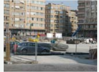
Interruption dans la clôture de chantier permettant le passage des véhicules et engins de chantier.

5° permettre l'accès aux fosses de plantation aux heures de chantier.