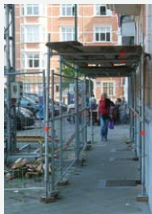
Couloir de protection contre la chute de matériaux.

4° est signalisé comme une piste cyclable dans le cas d'une piste cyclable existante et dans la mesure où la bande de circulation située le plus près du couloir de contournement pour cyclistes a une largeur minimale de 2,5 m. Dans tous les autres cas, le couloir de contournement pour cyclistes est au moins signalisé comme bande cyclable suggérée.