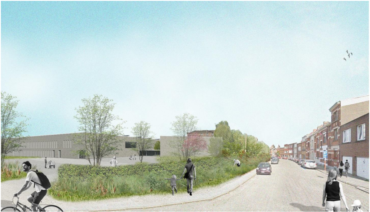
Vue 3D 2